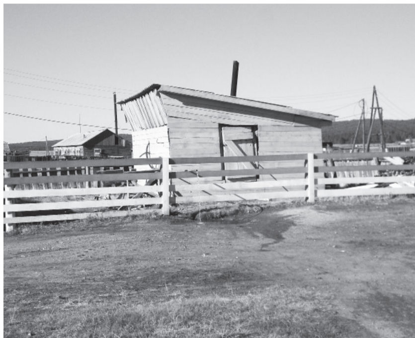
Одна из трех ониноборских водокачек отремонтирована.