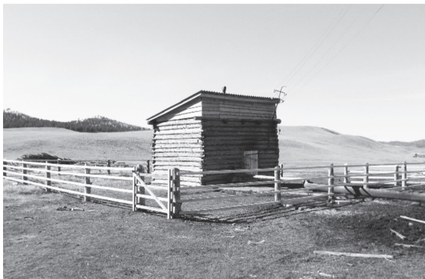
Ремонт ашангинской водокачки в самом разгаре.

- Занятия спортом - лучшее русло для направления неумемной энергии